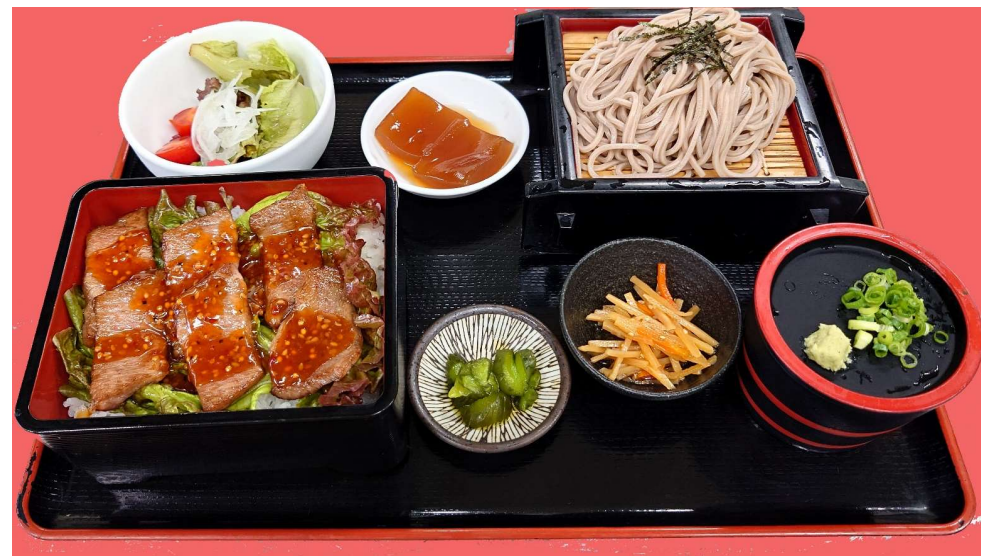
にし阿波産 黒毛和牛 焼肉重膳 2,700円