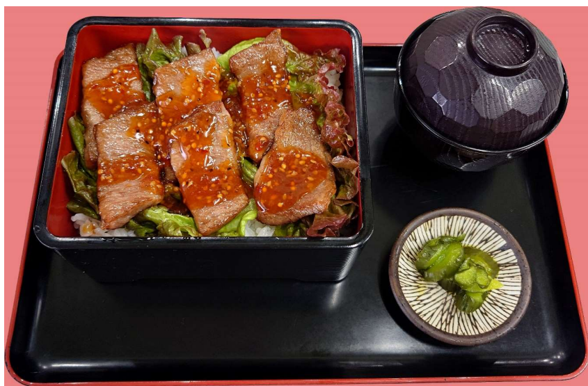
にし阿波産 黒毛和牛 焼肉重 2,200円